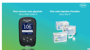
Accu-Chek Guide et Accu-Fine

Cette année encore, nous faisons le choix judicieux de venir soutenir votre catégorie diabète en mettant pour la première fois en télévision des aiguilles à stylos injecteurs aux côtés de nos deux lecteurs de glycémie phares : Accu-Chek® Guide et Accu-Chek® Mobile !