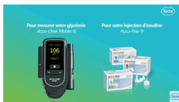
Accu-Chek Mobile et Accu-Fine