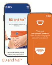
BD and Me™