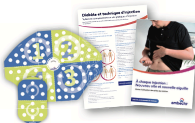
Outils d'éducation pour les patients