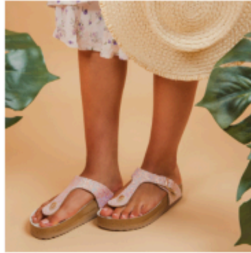
Woodstock 3.0 Cipria