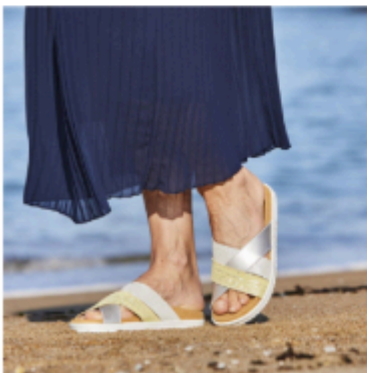
Ally Argent 40,99€ 32,79€