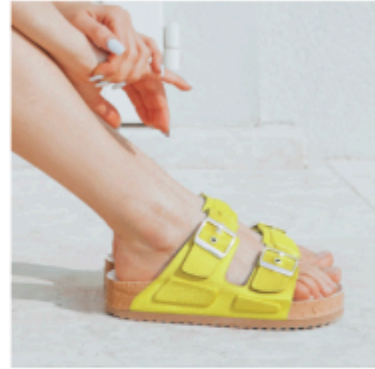
Woodstock 2.0 Sop