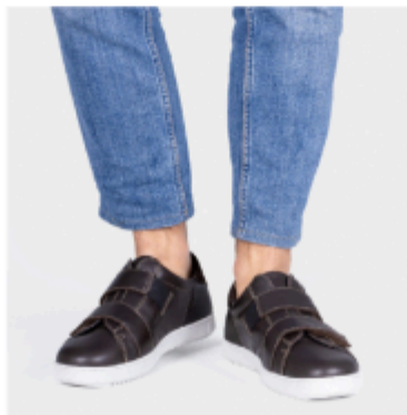
Yves Chocolat 65,99€ 55,99€