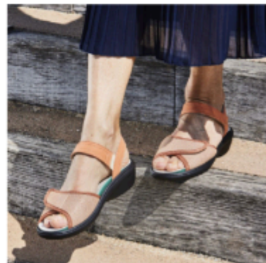
Denise Orange 45,99€ 36,79€