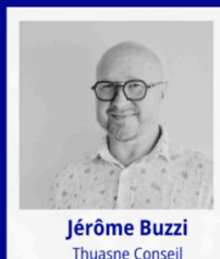
Jérôme Buzzi Thuasne Conseil